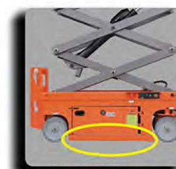
自动坑洞保护系统